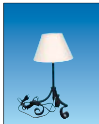
Lampenschirm: rund, klein, mit Stoff Größe: 13/Ø 20,5 cm Art.-Nr. 07723.00.00 rund, klein, ohne Stoff Größe: 13/Ø 20,5 cm Art.-Nr. 07719.00.00 Lampenfuß klein Größe: 35,5/18/18 cm Art.-Nr. 07716.00.00