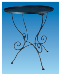
Tisch, rund Größe: 70,5/Ø 60,5 cm Art.-Nr. 07713.00.00