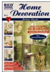
Art.-Nr. 23202.00.00 ISBN 3-935763-56-5