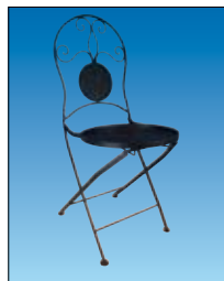
Stuhl Größe: 38/38,5/96 cm Art.-Nr. 07712.00.00