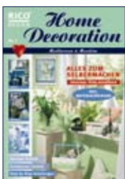
Art.-Nr. 23201.00.00 ISBN 3-935763-48-4