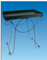
Serviertisch Größe: 79,5/70/40 cm Farbe: schwarzbraun Art.-Nr. 07714.00.00