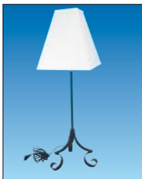
Lampenschirm: eckig mit Stoff Größe: 26,5/Ø 24,5 cm Art.-Nr. 07721.00.00 eckig, ohne Stoff Größe: 26,5/Ø 24,5 cm Art.-Nr. 07722.00.00 Lampenfuß mittel Größe: 56/25/25 cm Art.-Nr. 07717.00.00