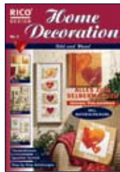
Art.-Nr. 23203.00.00 ISBN 3-935763-57-3