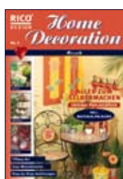
Art.-Nr. 23204.00.00 ISBN 3-935763-58-1