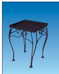
Beistelltisch 3-teilig klein: 21/18/18 cm mittel: 28,5/23/23 cm groß: 36,5/29/29 cm Art.-Nr. 07715.00.00