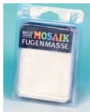
Fugenmasse weiß, 200 g Art.-Nr. 7060.100

4. Mosaiksteine säubern & trocknen: Nach dem Auftragen der Fugenmasse warten, bis die Masse ansteift (ca. 5 Minuten). Nun die überschüssige Fugenmasse mit einem feuchten Schwamm so lange abwischen, bis die Mosaiksteine wieder vollständig zu sehen sind. Tipp: Mit einem alten Frottiertuch nachpolieren. Nach ca. 24 Stunden ist die Fuge stabil.