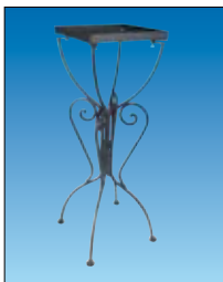
Hocker Größe: 62/21/21 cm Art.-Nr. 07711.00.00